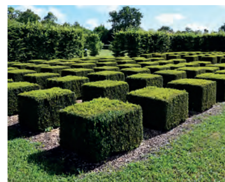
Le travail minutieux et patient du jardin vous séduira lors de vos visites au Bouquet