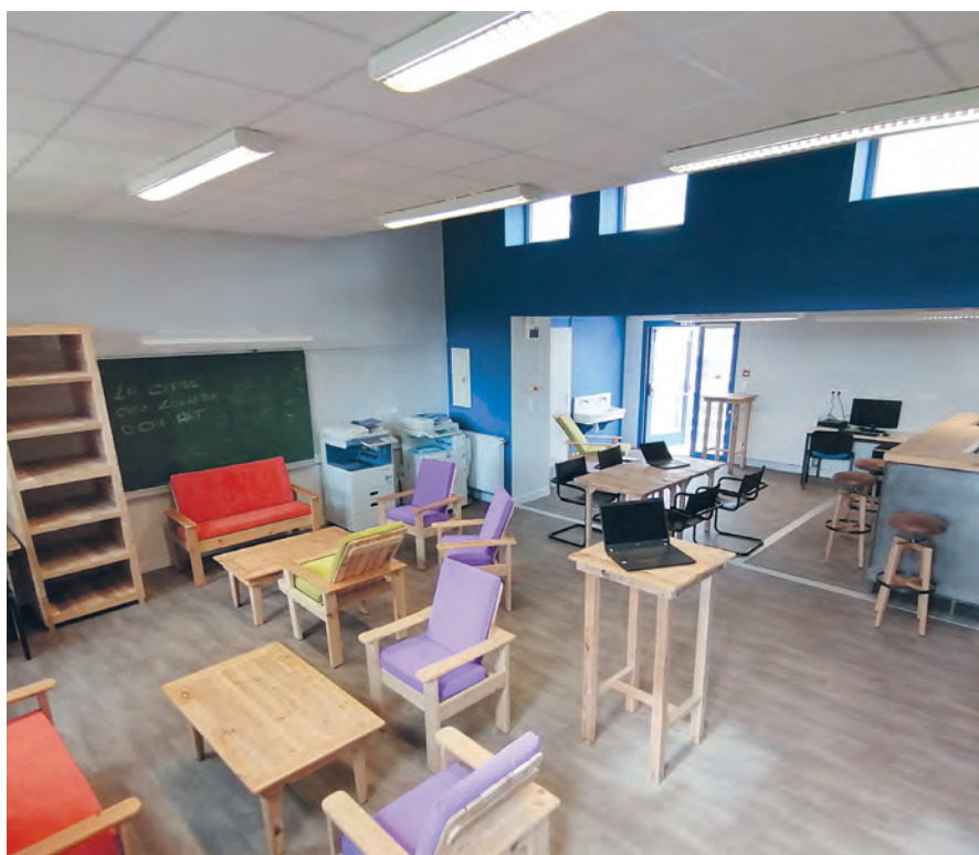
La Buissonnière vous accueille dans des locaux fraîchement rénovés