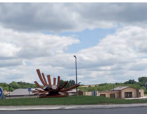
Parc économique du Diamant Noir

Dossier p. 6-9 ÉLECTIONS MUNICIPALES 2020