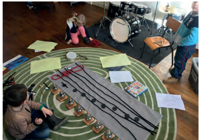
Les élèves de Music'Aventure en pleine découverte

Il se passe toujours quelque chose à Sorges-et- Ligueux-en- Périgord!