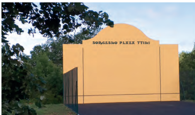
SORGESKO PLAZA TTIKI , le fronton n'attend que vous

Ces aménagements sportifs financés de moitié par le Grand Périgueux ont été réceptionnés le 15 juin 2020.