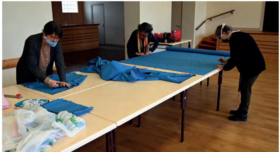
50 bénévoles se sont relayés pour coudre 3000 masques