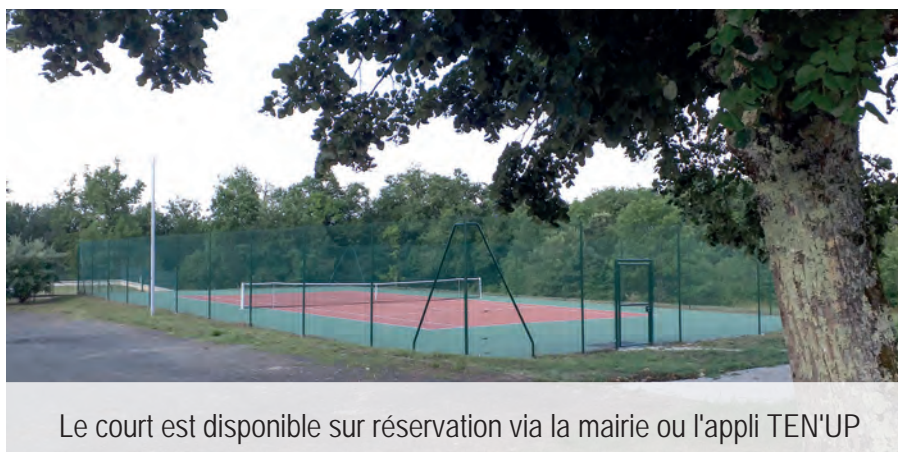
Le court est disponible sur réservation via la mairie ou l'appli TEN'UP