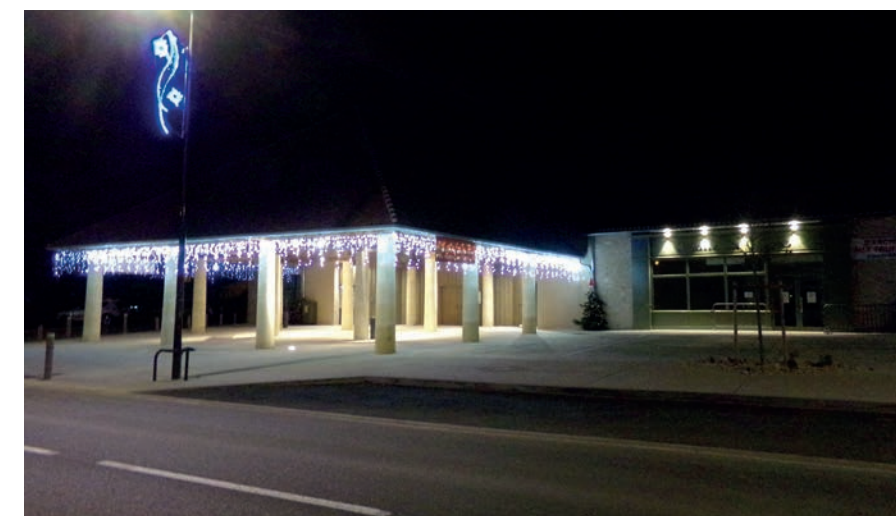
La nouvelle halle est doublée d'une halle couverte spécialement dédiée aux diamants noirs, une des passions du baron BERTRAND DE MALET