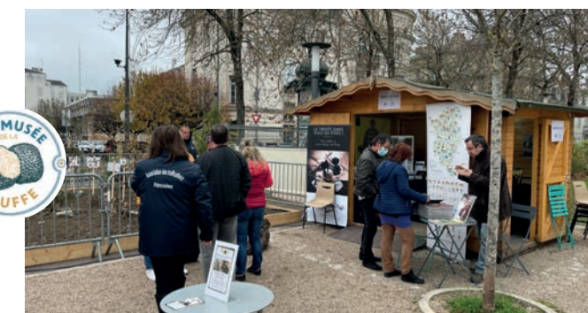
L'Écomusée de la truffe à l'occasion du Salon du Livre gourmand de Périgueux, les 19, 20 et 21 novembre

Du 19 au 21 novembre 2021, l'Écomusée était présent au Festival du Livre Gourmand de Périgueux.