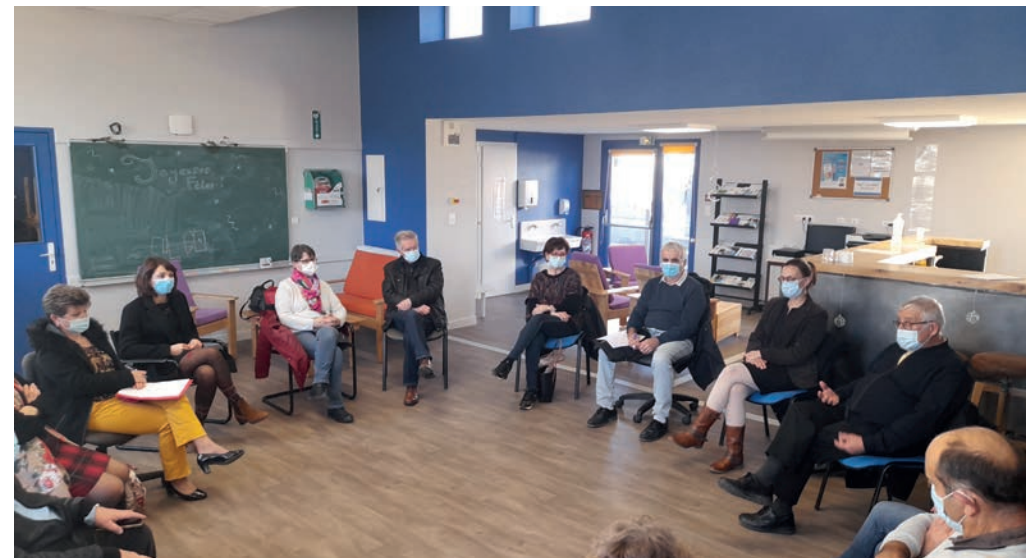
Présentation des avantages de la Maison France Services auprès des élus locaux qui ont découvert le village de Noël illuminé une fois la nuit tombée