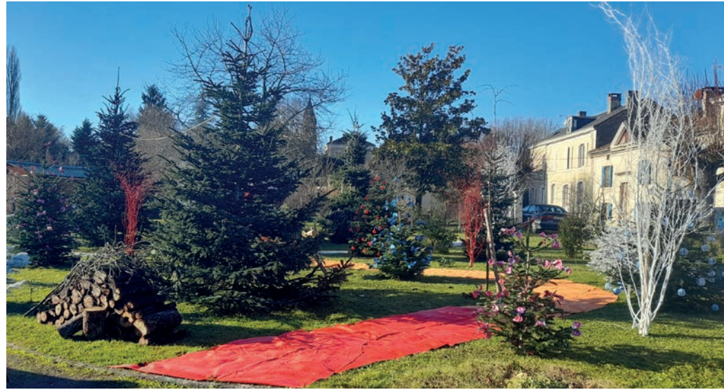
Les agents municipaux ont créé un joli village de Noël pendant que les enfants étaient invités à écrire leur lettre au Père Noël