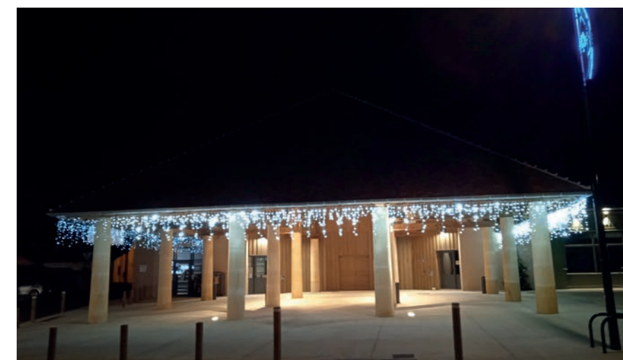
L'intérieur tout en bois confère une atmosphère chaleureuse à la nouvelle halle

sur les coteaux de « La Palue ». Plus de 60 Hectares ont été alors plantés. Bienfaiteur de la commune, il est aussi pour beaucoup dans sa renommée de capitale de la truffe noire du Périgord.