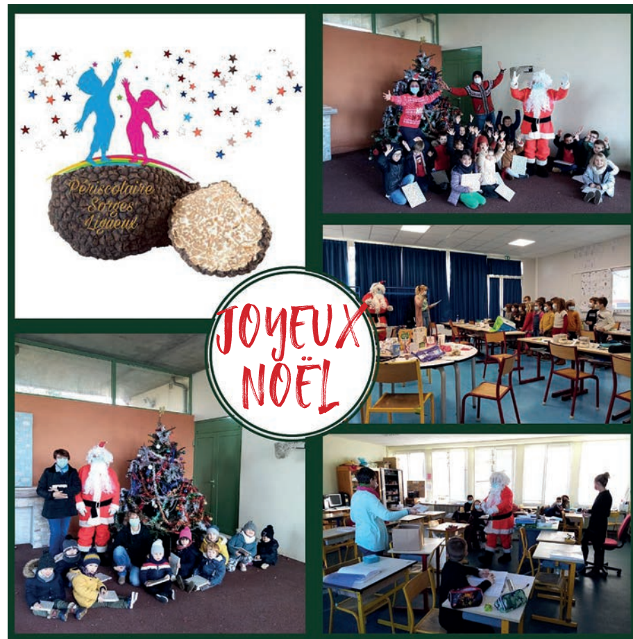
Le Père Noël, toujours aussi gentil et généreux, a distribué ses cadeaux aux enfants de l'école

Nous remercions les enseignants et les animateurs du périscolaire de leur avoir permis de s'investir dans cet échange intergénérationnel.