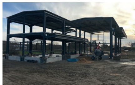
Le nouveau garage sera opérationnel au printemps 2022

Ce réseau permet un suivi des évolutions techniques liées au secteur de l'automobile et d'engager des actions commerciales ciblées.