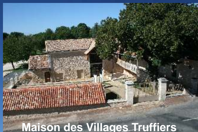
Maison des Villages Truffiers et Ecomusée