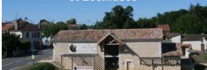
d'hier et d'aujourd'hui